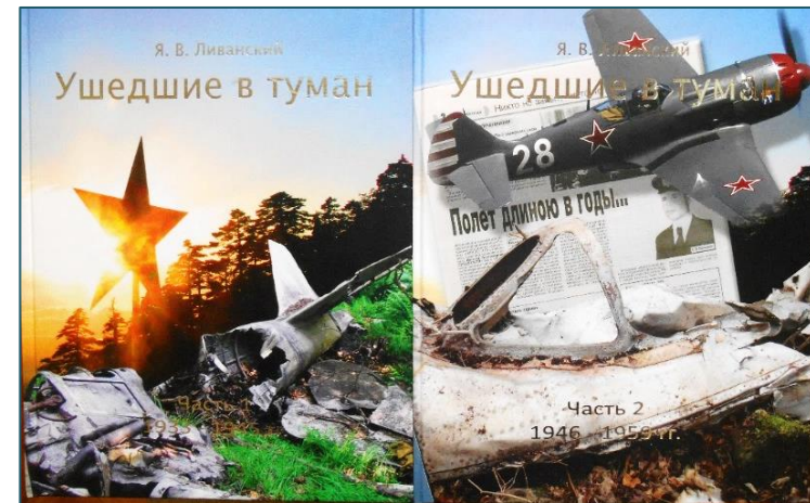
В 2018 г. издана книга в двух томах «Ушедшие в туман»

представляет собой группу людей, увлечённых военной историей и объединившихся для выездов на места катастроф военных самолётов, произошедших в период 1934 – 1968 гг. и для поиска незахороненных останков погибших экипажей. За десятилетия со времени падения каждый самолёт пророс деревьями или оказался хорошо скрытым под водой. Теоретическое предположение о их местонахождении зачастую удаётся подтвердить очевидцами, которым было на момент падения не более десяти – двенадцати лет. Впоследствии итогом этой напряжённой активистской работы стала книга в двух томах «Ушедшие в туман» (2018 год).