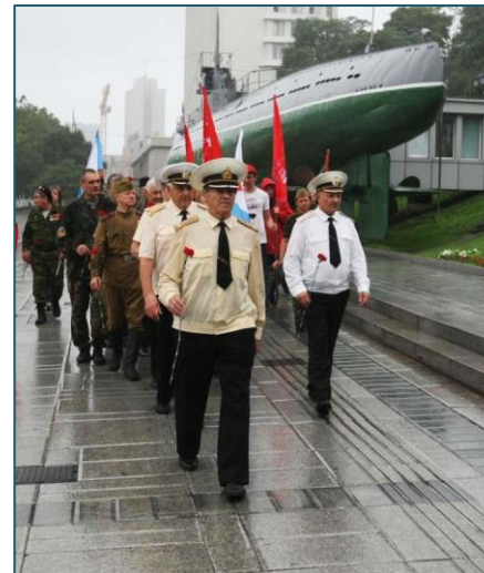
Участники поискового движения «Рокада»

Именно поэтому важно проследить не только развитие поискового движения, но его информационное сопровождение в формате оповещений, репортажей и электронных баз данных.