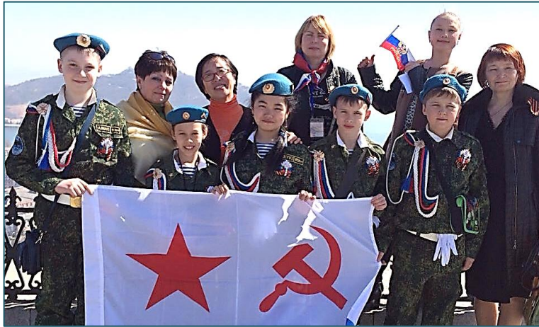
Инициация проекта «Вахта памяти. Порт-Артур», 2015 г.

возрасте деда начинает понимать происходящие события не так, как раньше, а по-иному.